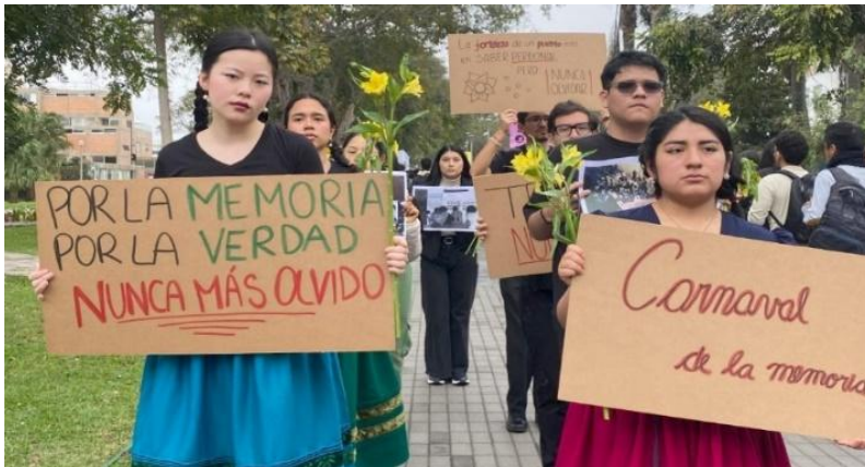
Imagen de la representación de la descolonización

Nota. (¿Qué es la Descolonización?.. Adaptado de educahistoria, por Cápsulas Educativas, 2023).